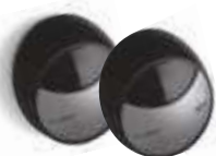
MOFB fotokomórki (para) BLUEBUS zasięg 15-30 m