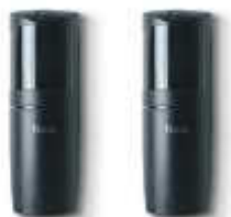
F210B fotokomórki (para) BLUEBUS, nastawne z kątem 210°, zasięg 15 m