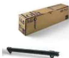
LOLA listwa zębata nylonowa M4, w odcinkach po 0,5 metra, pakowana po 10 sztuk, cena za 5 mb