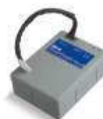
PS124 akumulator 24V 1.2 Ah z wbudowaną kartą ładowania